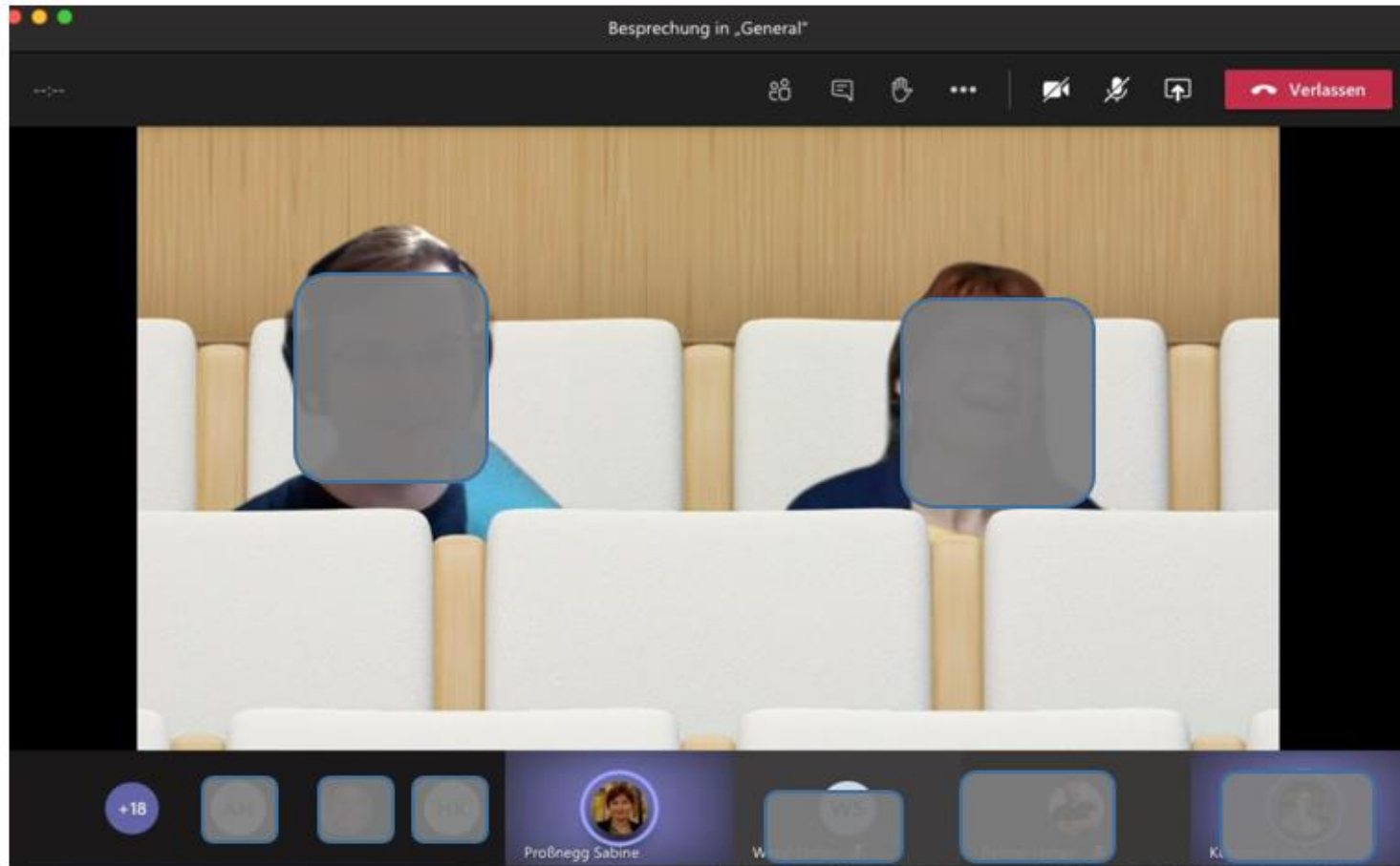
Abbildung 1: Vortragssetting im Online-Raum, Jürgen Zerbe.