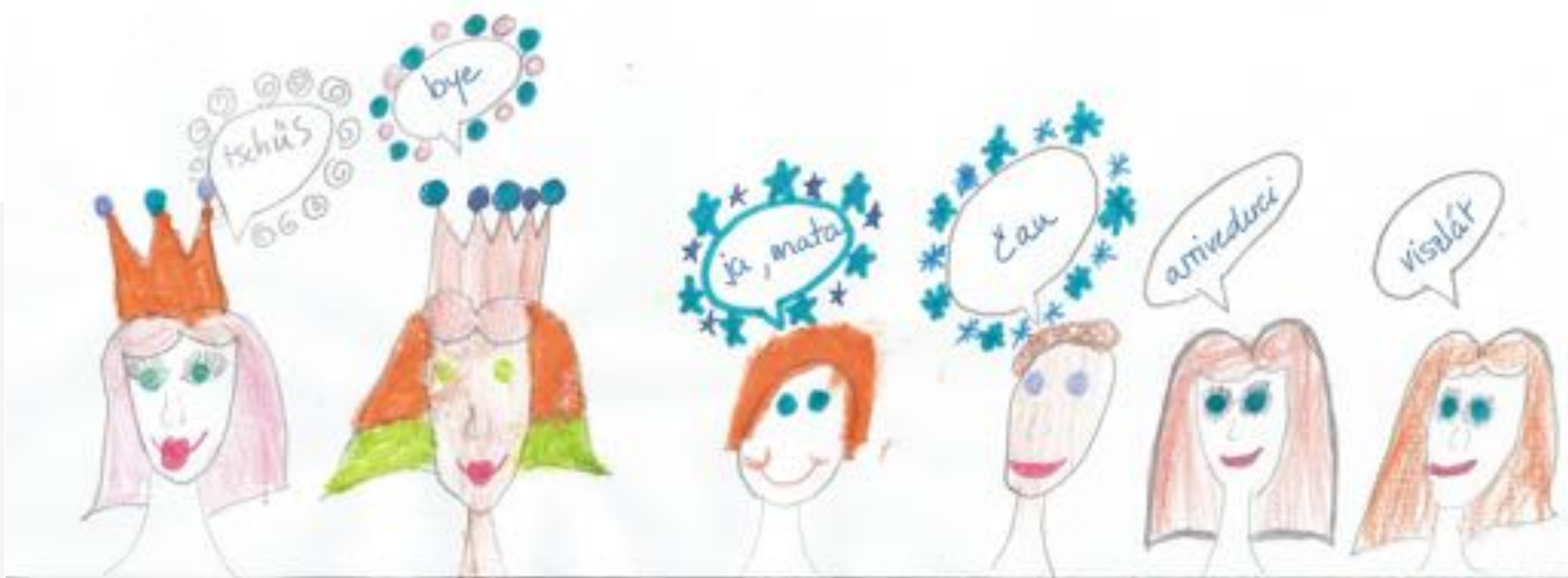
Zeichnung: Anna-Anastasia Feofilov

Thank you for your attention! Danke für Ihre Aufmerksamkeit!